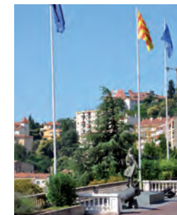
Place du Palais de Congrès