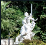
La ville arborée