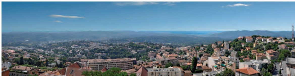
Vue panoramique sur la ville et la côte depuis la Résidence