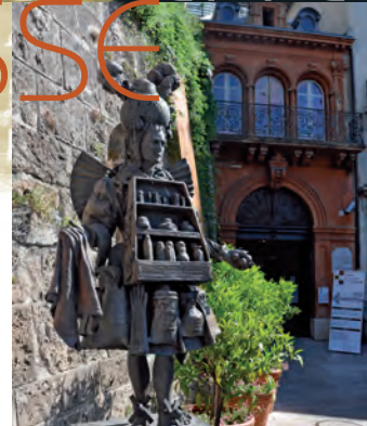
Le musée du parfum

De votre résidence proche de toutes les commodités, par l'avenue Emmanuel Beaudoin, vous accéderez facilement aux activités culturelles et aux administrations d'une ville au développement économique en plein essor, et bénéficierez d'une qualité de vie agréable dans la capitale mondiale du parfum.